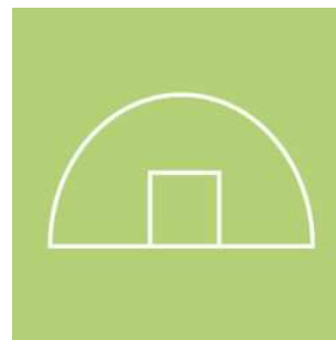
Rundbogen-nicht bei Kompletthaus nur bei ungeteilten Bögen

Nachträgliches Zubehör- Giebel und 2m-Verlängerung :